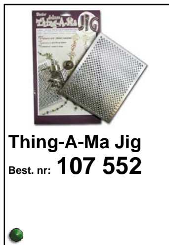
Thing-A-Ma Jig Best. nr: 107 552