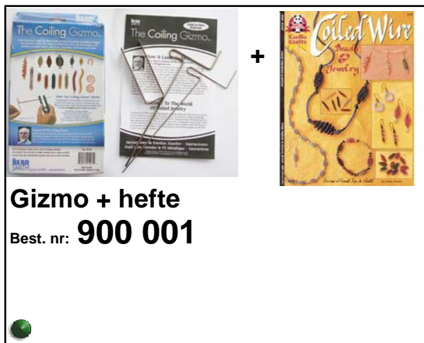
Gizmo + hefte Best. nr: 900 001